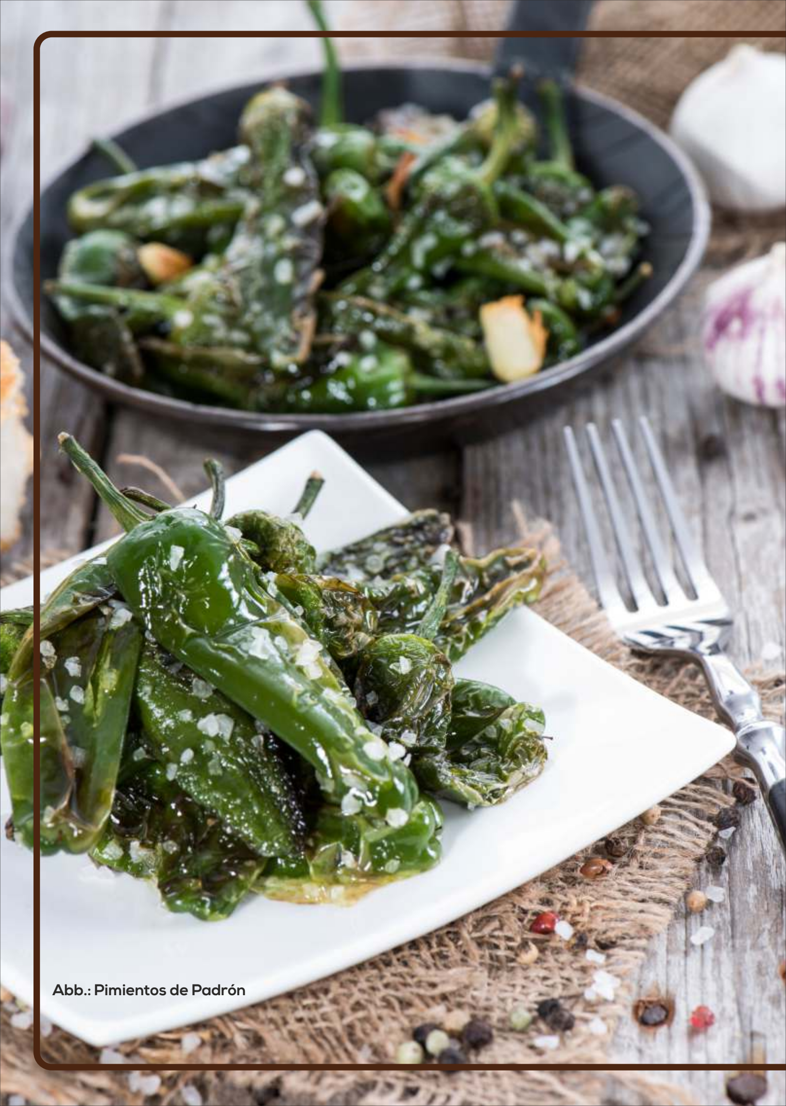
Abb.: Pimientos de Padrón