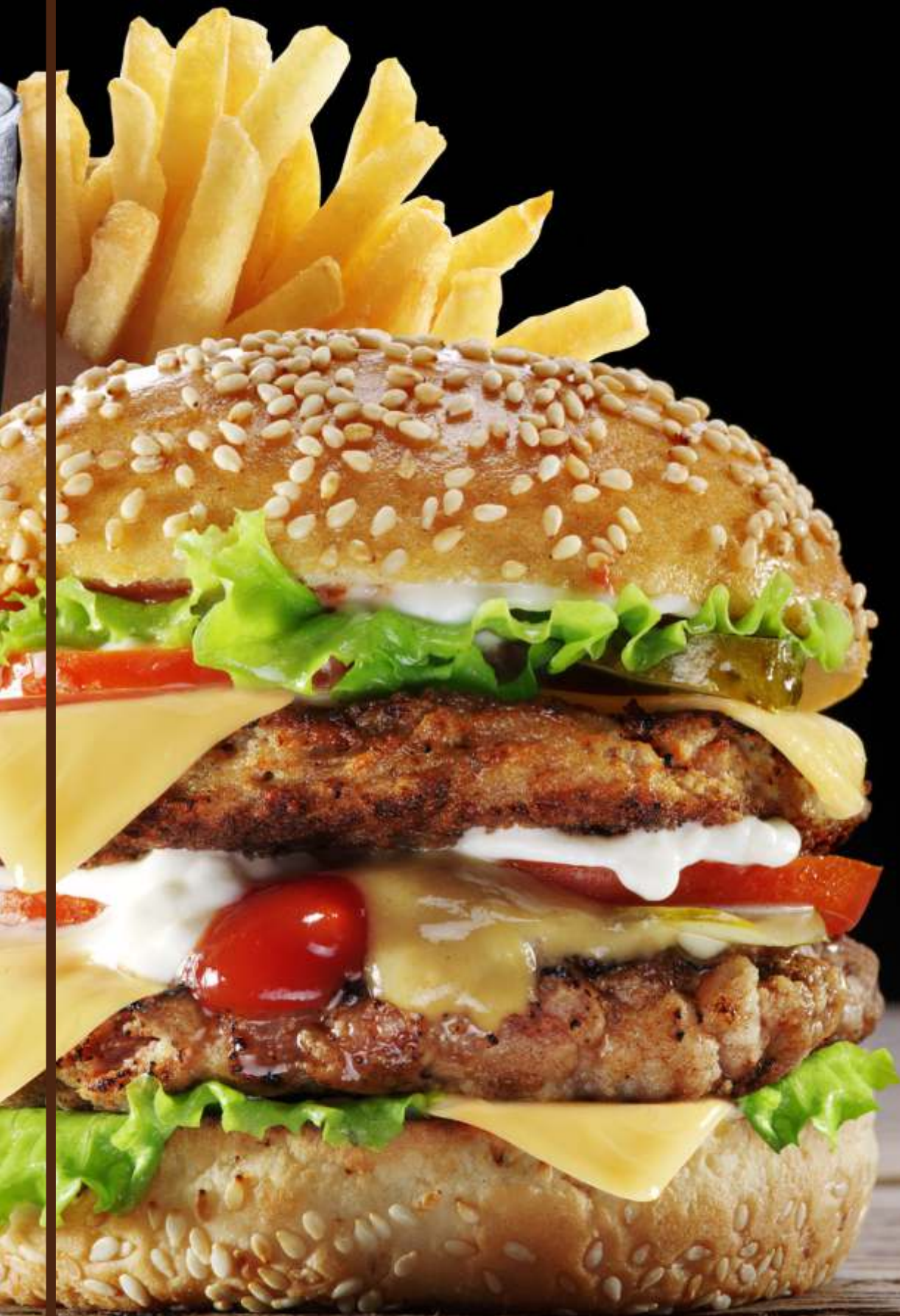
Abb.: Estancia Steakhouse Double Cheesburger